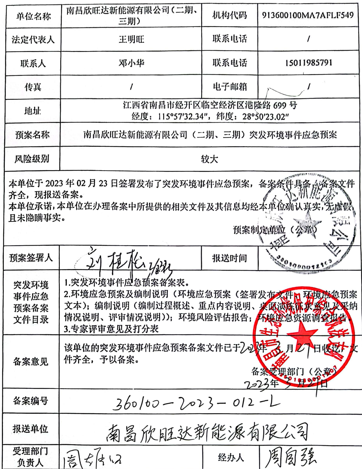
企业事业单位突发环境事件应急预案备案表

注: 备案编号由企业所在地县级行政区划代码、年份、流水号、企业环境风险级别(一般 L、较大 M、重大 H)及跨区域(T)表征字母组成。例如, 河北省永年县**重大环境风险非跨区域企业环境应急预案 2015 年备案, 是永年县环境保护局当年受理的第 26 个备案, 则编号为: 130429-2015-026-H; 如果是跨区域的企业, 则编号为: 130429-2015-026-HT。