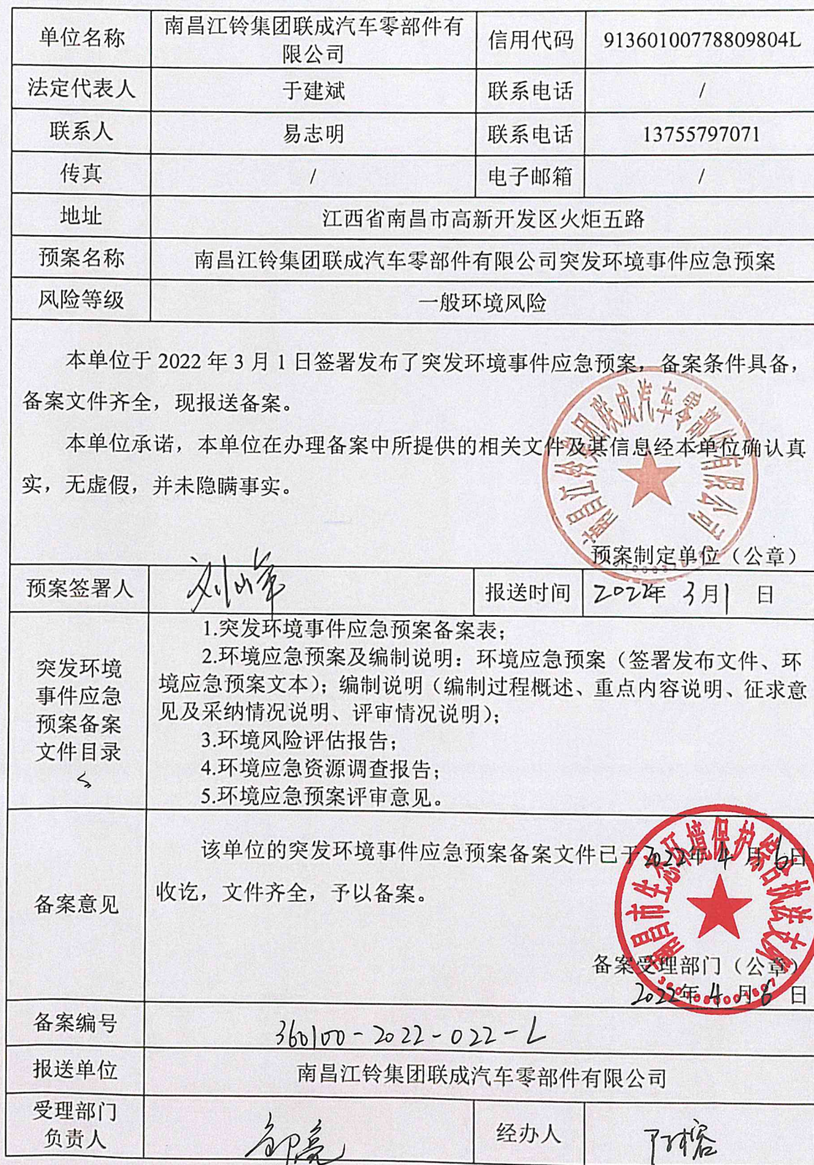
企业事业单位突发环境事件应急预案备案表