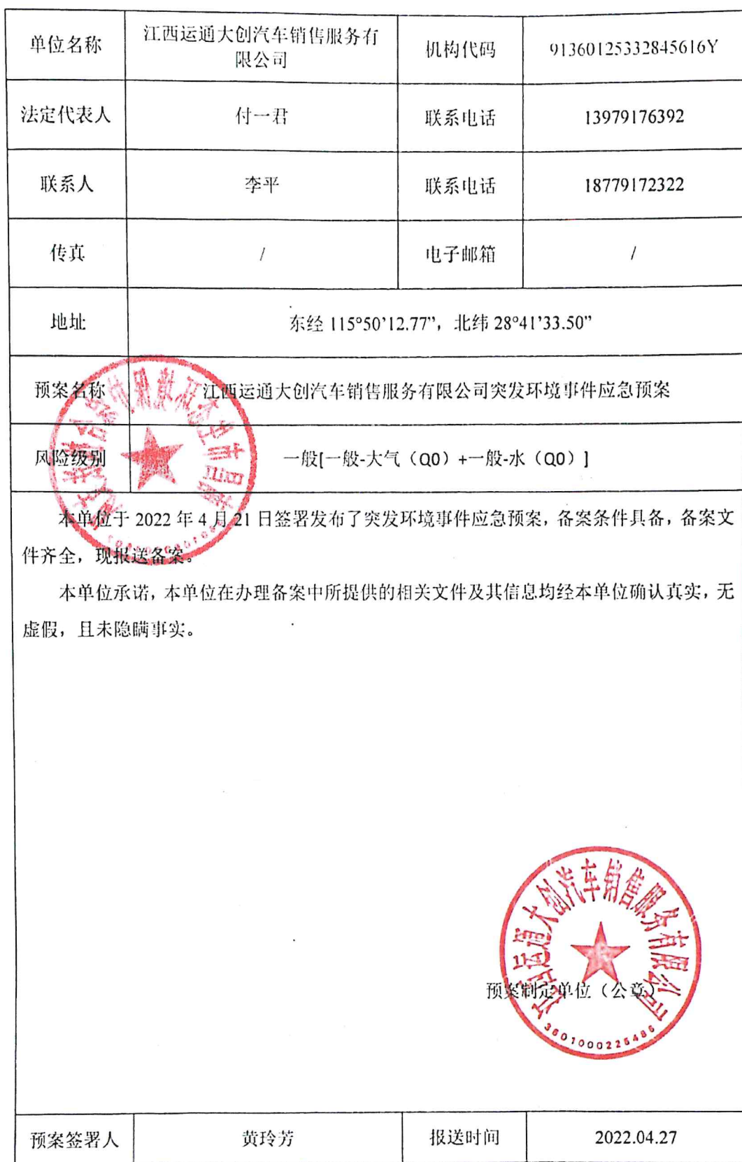
企业事业单位突发环境事件应急预案备案表