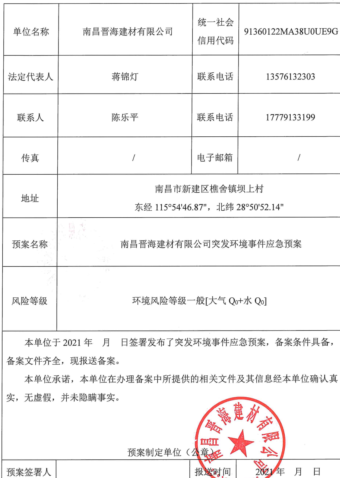
企业事业单位突发环境事件应急预案备案表